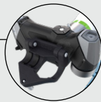
퀵 릴리스 디자인: 자동화 모드에서 핸드헬드 모드로 전환