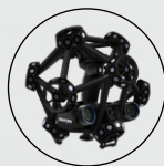
MetraSCAN 3D 호환 가능